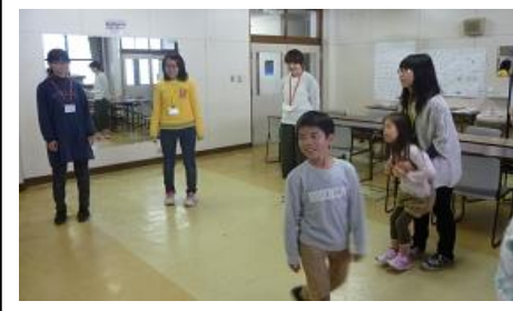
10月24日(土) 世界に一つだけのお皿 & 軽食作り